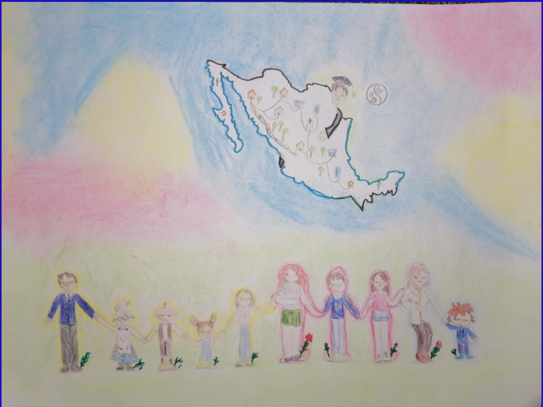
Tercer lugar Categoría B: “Mi comunidad siempre unida” Autor: Miguel Lizárraga