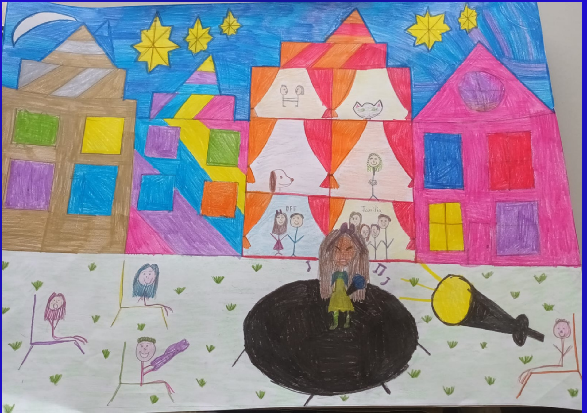
Segundo lugar Categoría A: "Cajeme la gran ciudad" Autora: Fernanda García