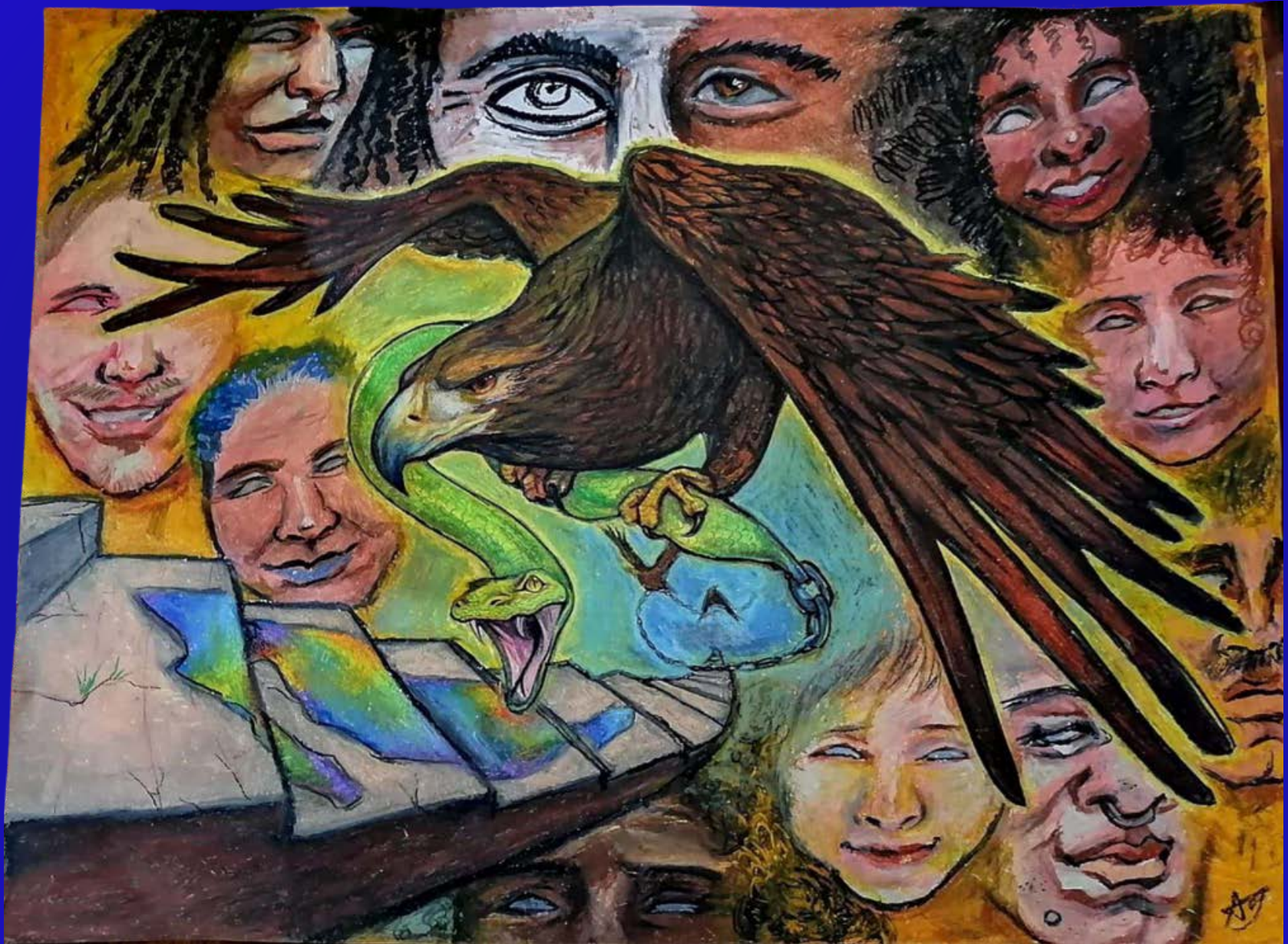
Segundo lugar Categoría D: “Escalera hacia el progreso” Autora: Sharon Oróz