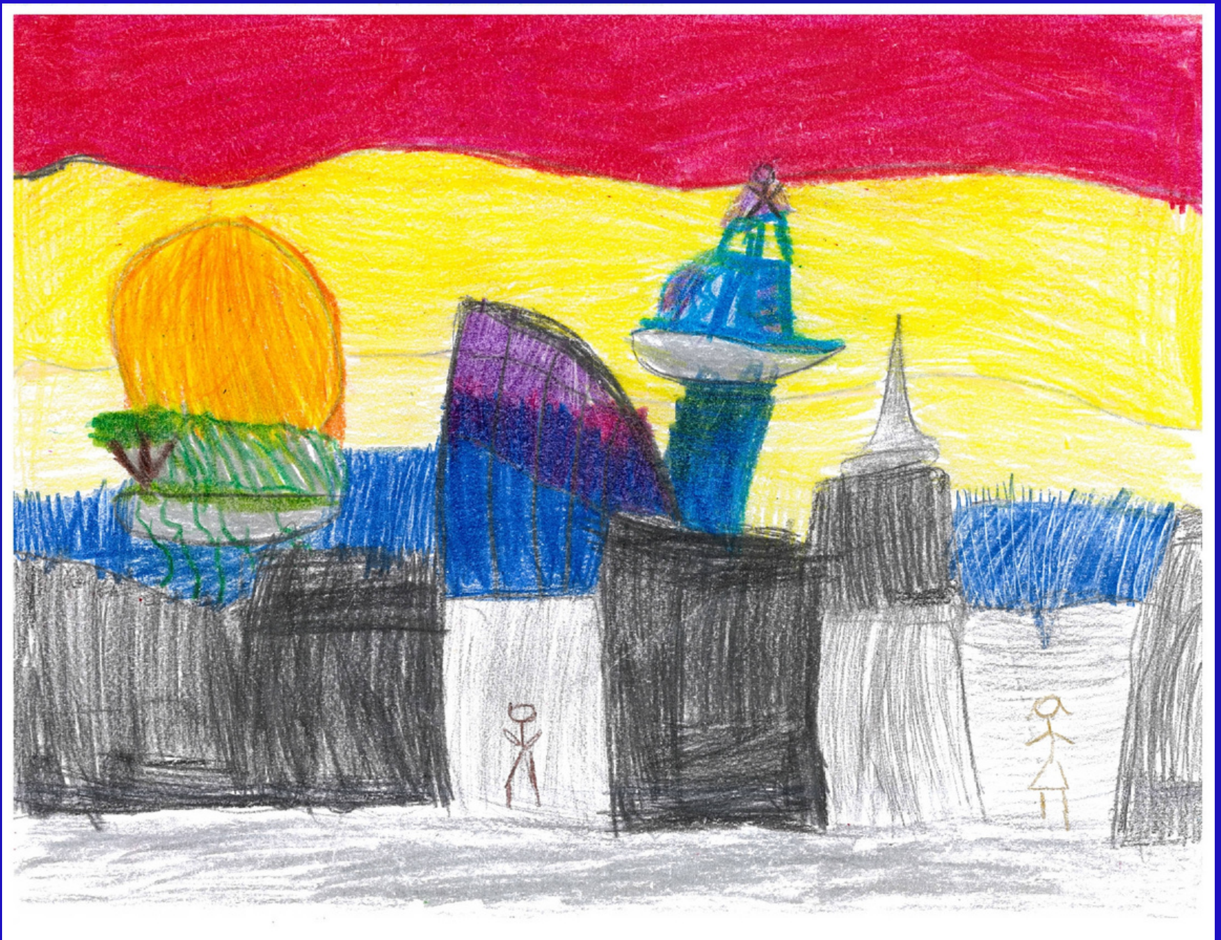
Tercer lugar Categoría A: "Cajeme robot" Autor: Pedro Peláez