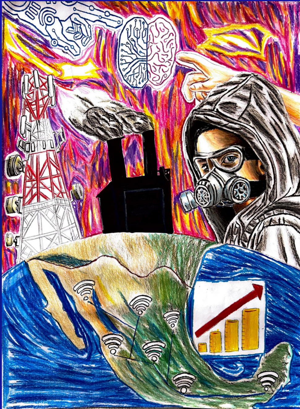
Tercer lugar Categoría D: “Dónde diablos jugarán los niños” Autor: José Velarde