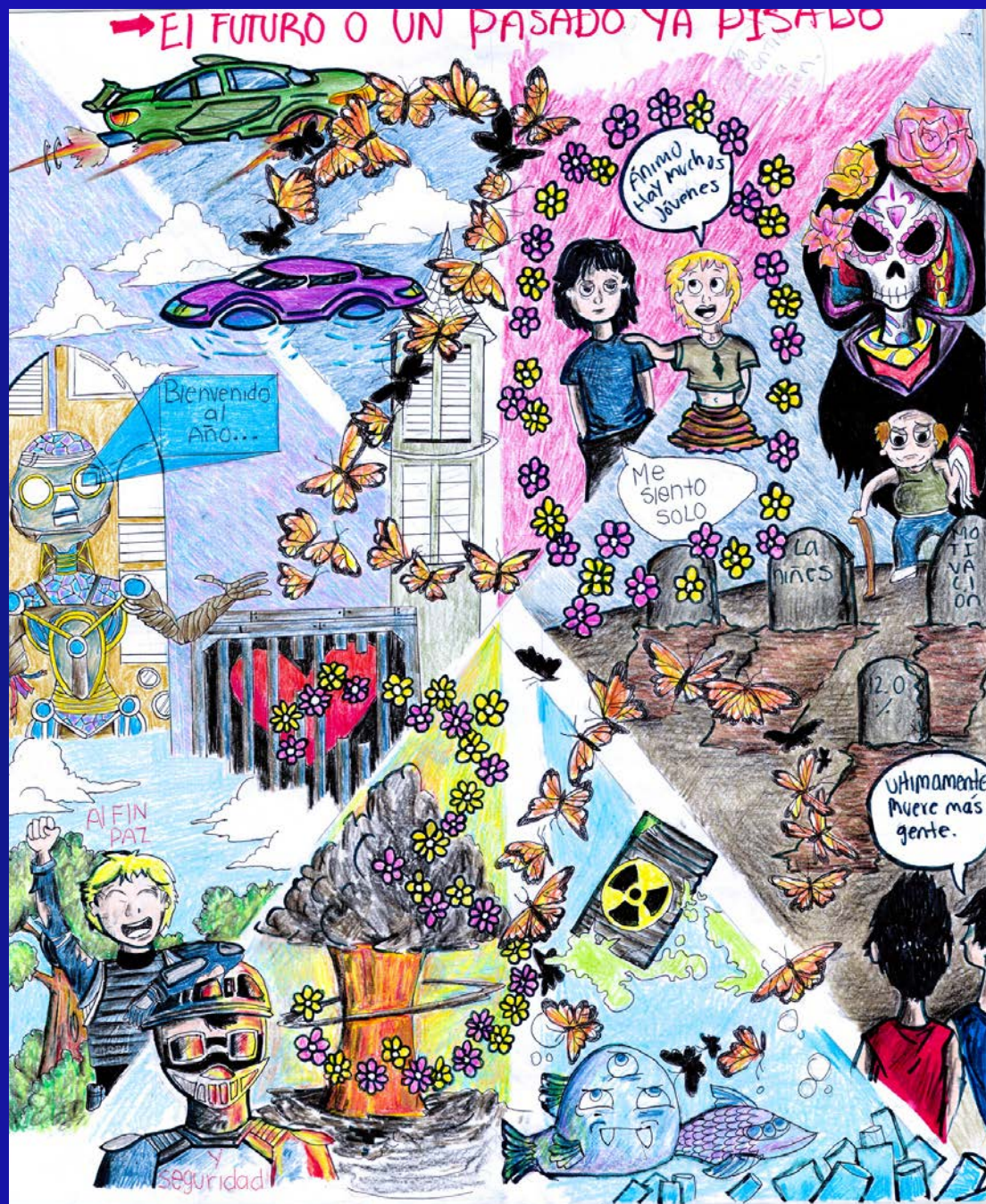
Segundo lugar Categoría E: “¿El futuro o un pasado ya pisado?” Autor: Jesús Galindo