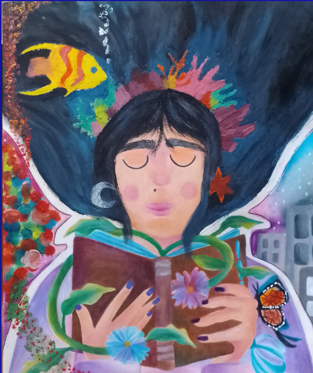
Tercer lugar Categoría E: “Una perspectiva sustentable” Autora: Paola Carreras