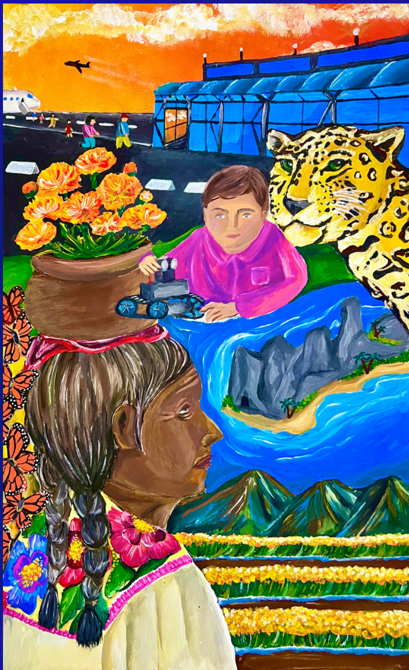
Primer lugar Categoría D: “Florecer de horizontes; En la cima de la grandeza de nuestro país” Autor: Ramón Duarte