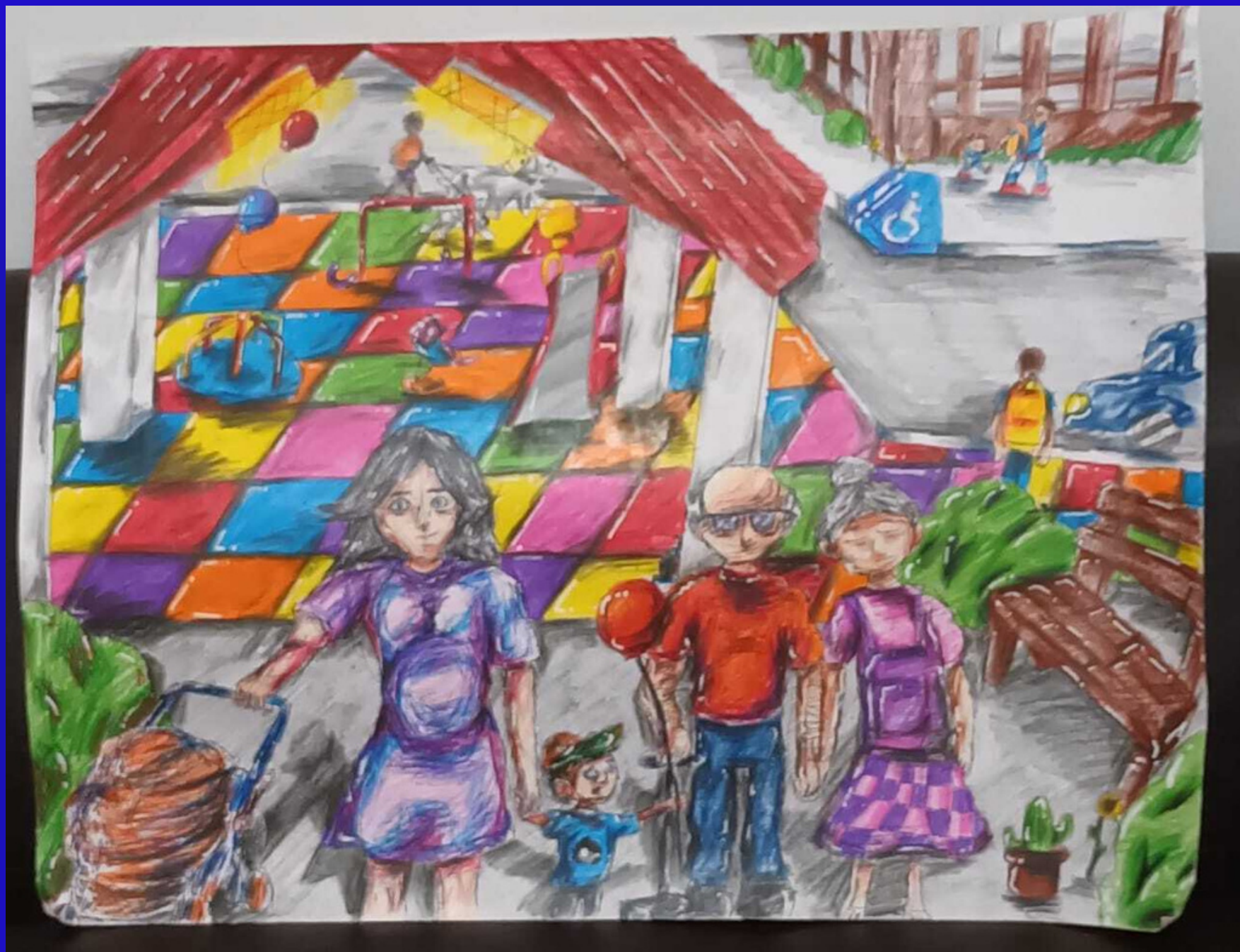
Primer lugar Categoría B: “Los colores de mi futuro” Autor: Juan Maldonado