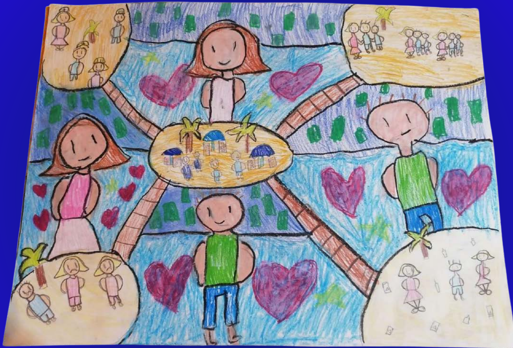
Primer lugar Categoría A: "Un México para cada persona" Autor: Milán Guerrero