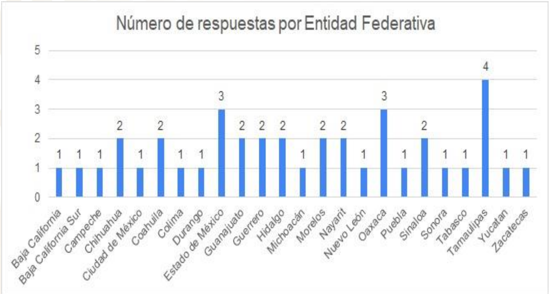
Número de respuestas por Entidad Federativa

Se recibieron 39 respuestas a través de 24 Entidades Federativas.