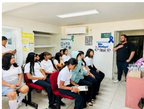
Centro de Salud Rural Plan de Ayala