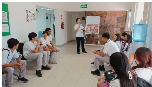
Centro de Salud Rural Átil